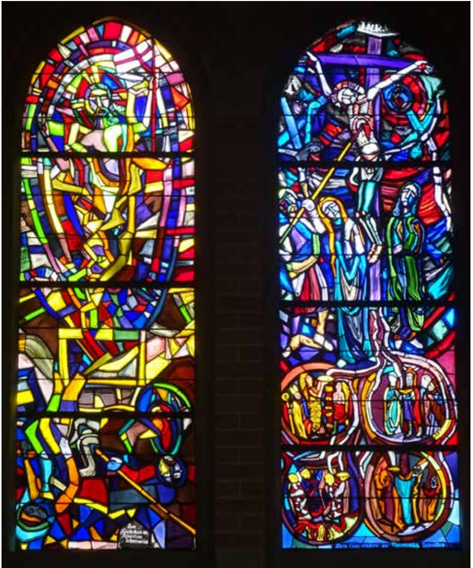
Herz Jesu Kirche, Bregenz “Die Auferstehung” und “Die Kreuzigung” Martin Häusle 1958 Ausführung Rudolf Marte Bregenz