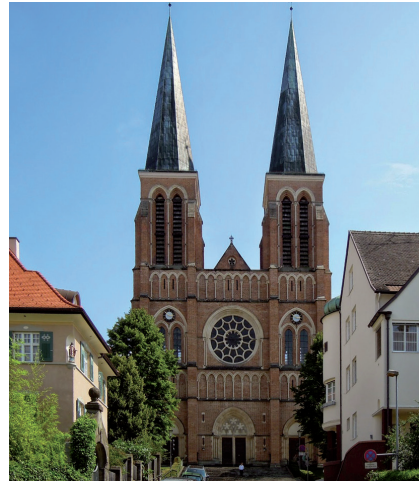
Der gedenk | kreuz | weg ist eine Installation in der Herz-Jesu Kirche, Kolpingplatz 1, 6900 Bregenz